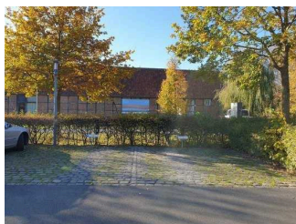
Öffentlicher Parkplatz für Menschen mit Behinderung

Wir haben für Sie einige Fotos aus dem Betrieb / Angebot zusammengestellt. In den Detailberichten finden Sie weitere Fotos.