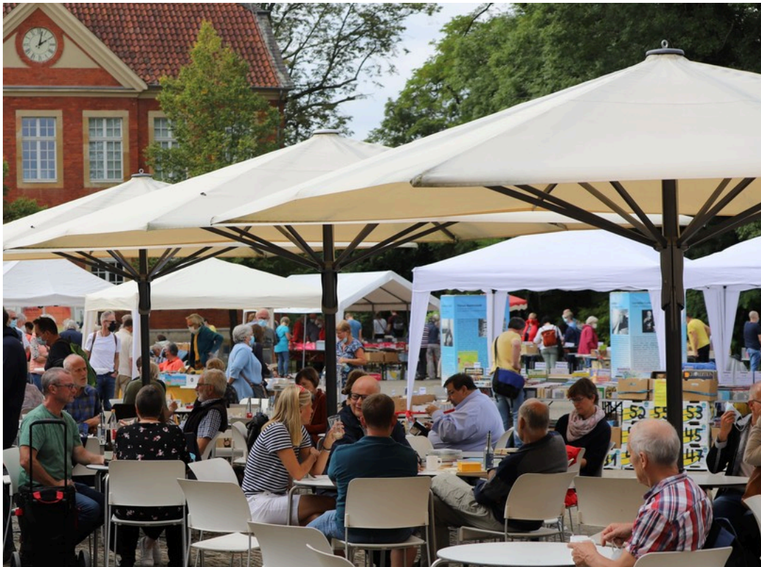
Kulturcafé im Haus Nottbeck | Dirk Bogdanski