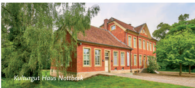
Kulturgut Haus Nottbeck

Kulturgut Haus Nottbeck Landrat-Predeick-Allee 1, 59302 Oelde www.kulturgut-nottbeck.de Tel.: 02529 9497900 Literaturmuseum Di-Fr 14.00 - 18.00 Uhr Sa, So und an Feiertagen: 11.00 - 18.00 Uhr Café Informationen und Öffnungszeiten unter www.kulturgut-nottbeck.de