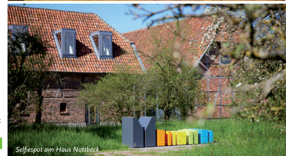
Selfiespot am Haus Nottbeck