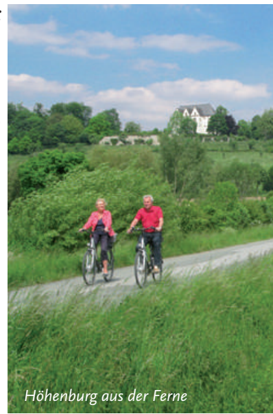
Höhenburg aus der Ferne

Weit ins Land blickt man aus der luftigen Höhe des steil abfallenden Bergrückens, auf den die Höhenburg Stromberg gebaut ist. Picknicktische und Bänke laden den Radwanderer zu einer ersten Rast ein – es lohnt sich kurz Zeit zu nehmen für den wundervollen Ausblick.