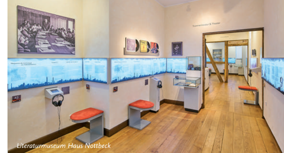
Literaturmuseum Haus Nottbeck

Texte und Konzeption: Touristische Arbeitsgemeinschaft „Parklandschaft Kreis Warendorf“ Titelbild Kulturgut Haus Nottbeck / Christian Ring, weitere Fotos: Forum Oelde (Vier-Jahreszeiten-Park, Känguru); Münsterland e.V. / Philipp Föltling (Schloss Rheda, Haus Nottbeck Literaturmuseum und Markenbank, Pflaumenblüte Stromberg), Christine Schneider (2x Höhenburg Stromberg) Kartengrundlage: © Geodaten: Kreis Warendorf / Maßstab 1: 40.000, © Geobasisdaten: © LAND NRW (2021) - Lizenz dl-de/by-2-0 ( www.govdata.de/dl-de/by-2-0 )