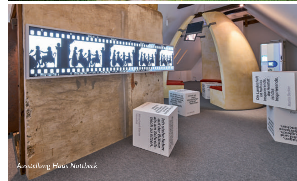
Ausstellung Haus Nottbeck